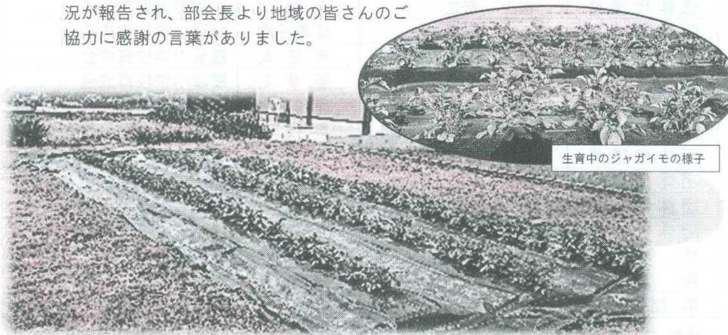
生育中のジャガイモの様子